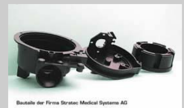
Bauteile der Firma Stratec Medical Systems AG