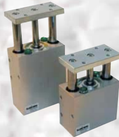
Zylinder mit Führung