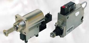
Zylinder - Ventil Einheit